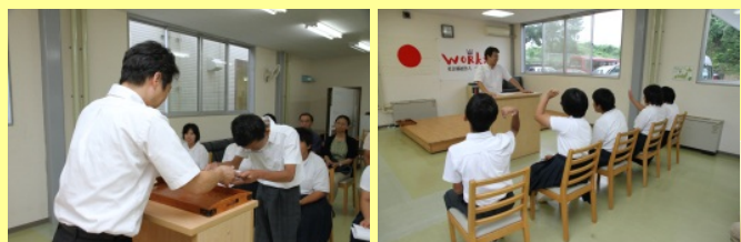
【前期サマースクール修了式の様子】

サマースクールでは普段の学校生活では体験できない働く場における作業実習や公文式学習で集中力を身に着ける体験学習やビジネスマナー講習などを実施しています。