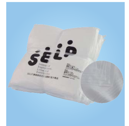
《C-04》シーツウエス シーツ生地で吸水性があり、汚れを拭き取ったときにわかりやすい。 1kg ¥350