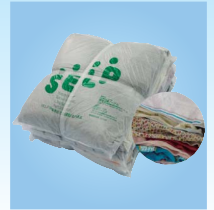
《C-02》色薄メリヤスウエス 色のついたTシャツ・ポロシャツ生地、限りなく綿100%に近いもの。プリントしてある場合もある。 1kg ¥300