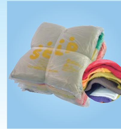
《C-01》色厚メリヤスウエス トレーナー生地で、厚手の色綿。 1kg ¥280