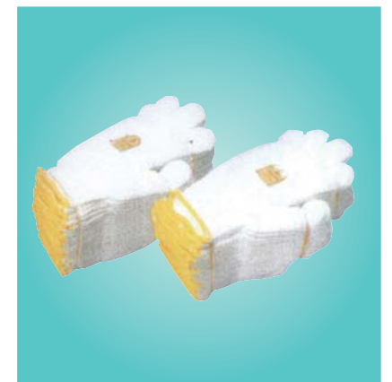
《C-06》軍手(山吹/薄手) 1ダース ¥300