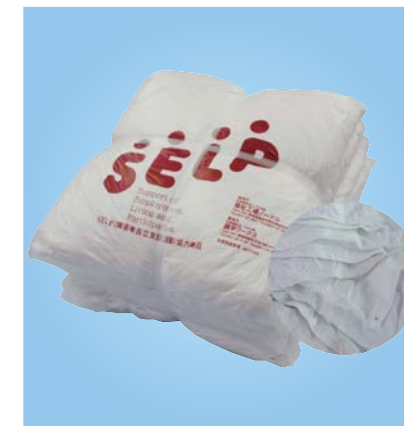
《C-03》色薄メリヤスウエス(白地) 白Tシャツやポロシャツ、肌着などで限りなく綿100%に近いもの。プリントしてある場合もある。 1kg ¥400