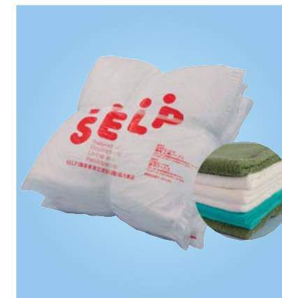
《C-05》タオルウエス タオル生地で、吸水性は抜群に良い。 1kg ¥550